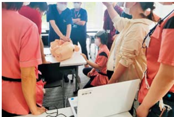
勉強会の様子：肩甲難産時の対応

出産は、大きな喜びがある一方で「安全なお産」ばかりではありません。近年、妊娠や出産に伴うリスクは増加傾向にあります。妊娠中は問題なく経過していても、時に出産時はお母さんや産まれたベビーに危険が伴うこともあります。異常時に対応できるスタッフの育成を目指し、医師を含めた振り返りや新生児蘇生法（NCPR）・新生児処置、肩甲難産時の対応等の学習会、超緊急帝王切開（グレードA）や産後大出血時のシミュレーションを定期的で開催し、部署全体、ときには病院全体で緊急時の対応ができるように知識・技術の向上に努めています。