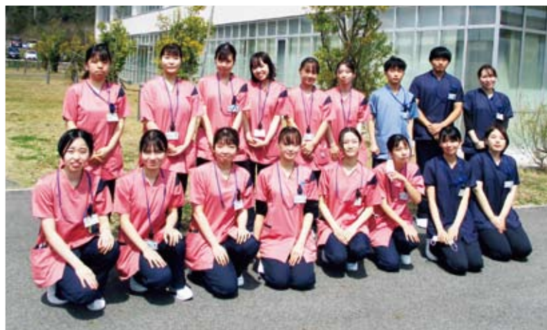
令和6年度 新入職員